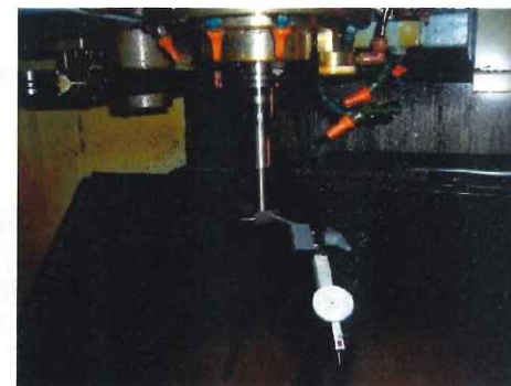
マシニングセンタへ

〒918-8018 福井県福井市大島町戊亥503-2 TEL 0776-36-2087 FAX 0776-36-7929