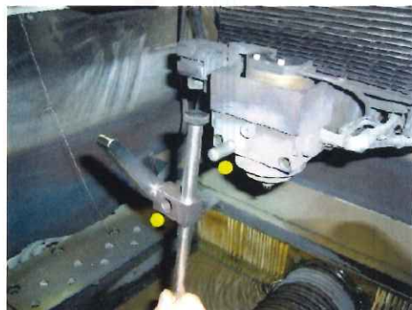
ワイヤー加工機へ シンプルでスマートな 取り付け