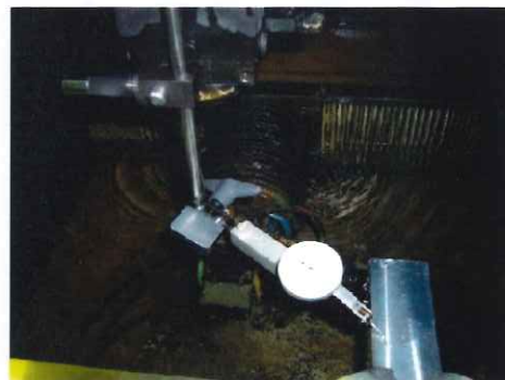
ワイヤー加工機での測定